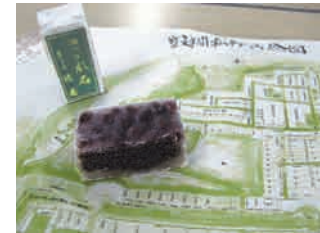
徳若/松本らしい伝統和菓子