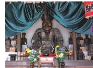
十王堂/えんま大王像