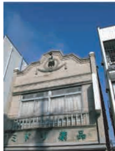
中町/ミドリ薬局看板建築