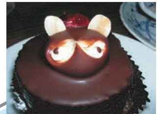
翁堂喫茶/たぬきケーキ